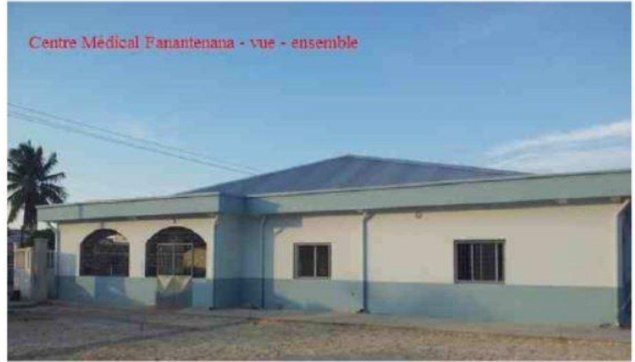
Centre Médical Fanantenana, implanté en centre ville de Majunga - quartier bas "Tsararano Ambony"